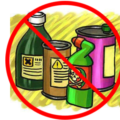
विषाक्त रसायनों और क्लीनरों का उपयोग करना