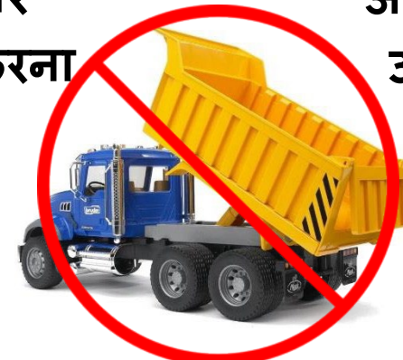
टैंकों/लीचिंग बेड के पास भारी / मशीनरी चलाना