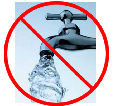
अधिक पानी का उपयोग करना