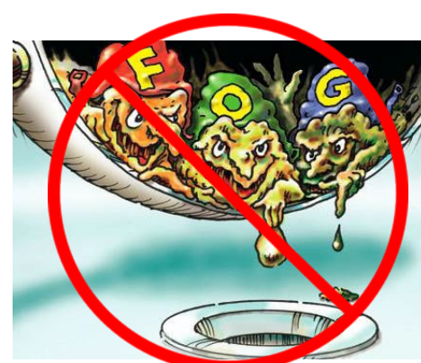
चर्बी, तेल और ग्रीस