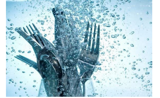
बर्तनों को धोने वाला पानी