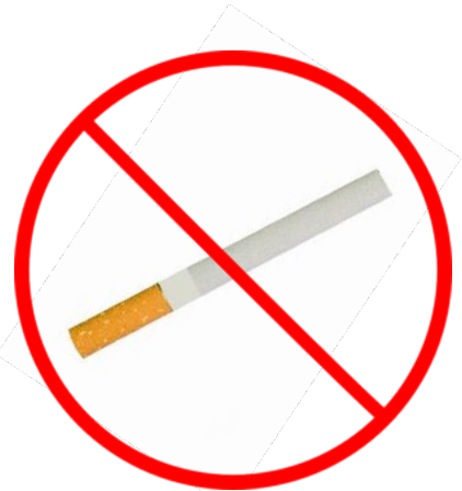
सिगरेट के टुकड़े